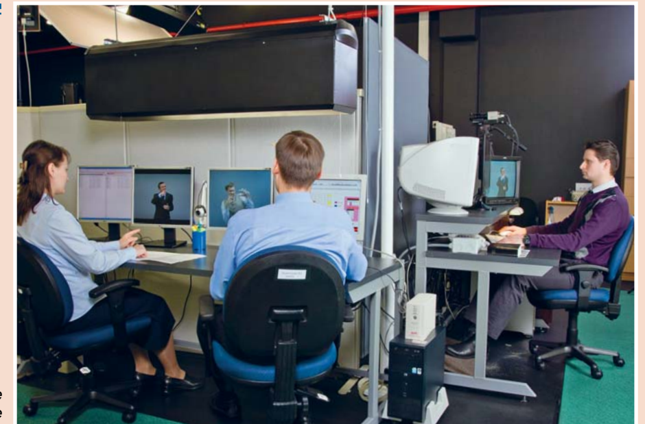
3. Корректурa и редактирование публикаций на жестовом языке