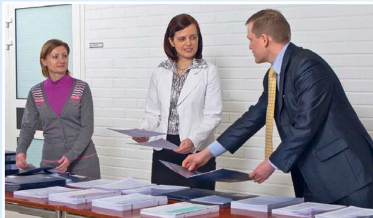
Подготовка выставки для медицинской конференции

Служебный отдел руководит проповеднической деятельностью Свидетелей Иеговы в России и Белоруссии. Он ведет переписку с разъездными надзирателями, старейшинами собрания и пионерами. Он также собирает отчеты о проповедническом служении, о том, как прорабатываются территории собраний, и о пионерских назначениях. Те, кто служит в этом отделе, планируют районные, областные и специальные однодневные конгрессы. Они также организуют разные программы обучения, которые помогают Свидетелям Иеговы стать более умелыми проповедниками Божьего Царства.