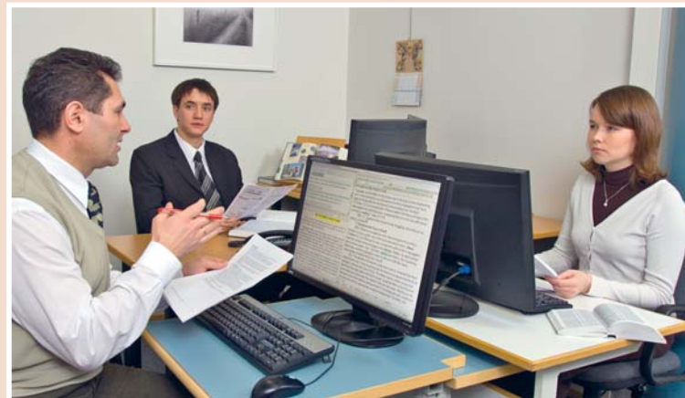
Переводчики работают в группах, подготавливая видео- и печатные публикации