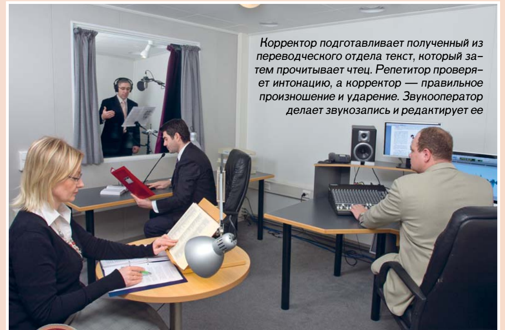
Корректор подготавливает полученный из переводческого отдела текст, который затем прочитывает чтец. Репетитор проверяет интонацию, а корректор — правильное произношение и ударение. Звукооператор делает звукозапись и редактирует ее